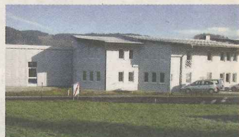
Die Firmenzentrale in Lichtenberg.

Mit 35 Mitarbeitern in der Unternehmenszentrale in Lichtenberg erwirtschaftet das Unternehmen einen Jahresumsatz von ca. 7,5 Mio. Euro. Für 2010 ist die Stimmung vorsichtig optimistisch, weil nach einem ruhigeren Jahr 2009 die Umsatz- und Auftragswerte für die letzten Monate bereits wieder kräftig gestiegen sind. Der Exportanteil des Unternehmens liegt bei über 90 Prozent. Für den eigenen Technikernachwuchs werden derzeit 7 Lehrlinge in Maschinenbautechnik ausgebildet.