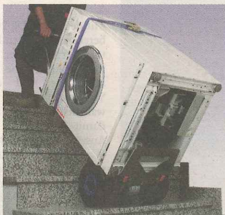
Schwere Lasten sind kein Problem.

Ländern verkauft werden. Nach diesem ersten Exportverkaufserfolg wurde kontinuierlich das internationale Händlernetz erweitert.