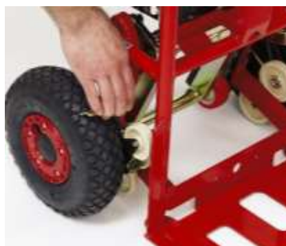
oder mit der Hand

Wichtig: Reifendruck minimal 2,5 bar wegen Bodenfreilauf.