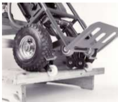
LIFTKAR gebremst auf der Stufenkante