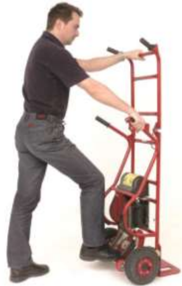
Zum leichteren Anheben von schweren Lasten Fuß auf nach hinten gefahrene Stützradachse stellen!