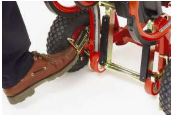
Mit dem Fuß weiter drehen bis zum Neutralstand (bei Neutralstand ruht das mittlere Rad gegen eine Nocke am Rahmen. Der Brems-Haken steht frei vom Rad).