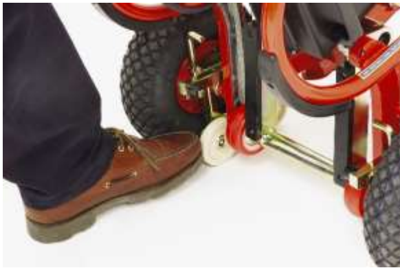
Hinteres Laufrad der Bremse nach vorne drücken