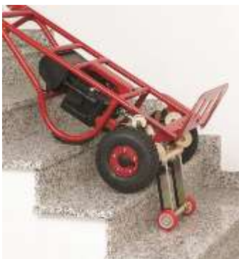
Abstellposition auf der Stiege

Durch Neigen des Rahmens kann man den Punkt des Gleichgewichts ändern. Achten Sie darauf, dass beim Neigen des Rahmens auch der Arbeitswinkel des Hebeseystems verändert wird. Dadurch wird die maximale Stufenhöhe kleiner. Das ist auch dann wichtig, wenn man selbst bereits auf dem Treppenabsatz steht und die Karre noch die letzten Stufen bis zum Absatz schaffen muss.