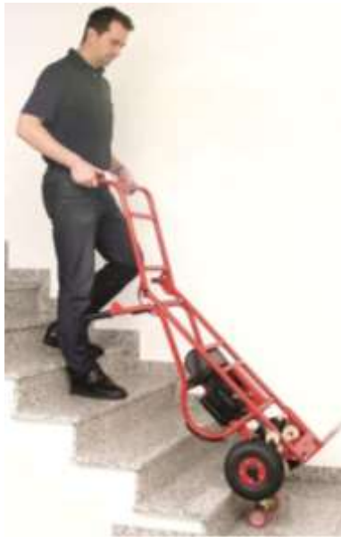
Für niedrige Lasten z.B. Waschmaschinen