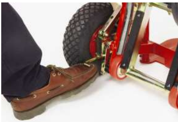
Mit Fuß oder Hand die Bremse in Neutralstellung bringen.