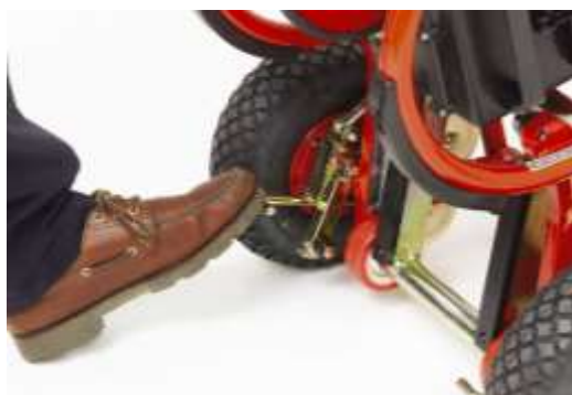
Mit dem Fuß (fest drücken)