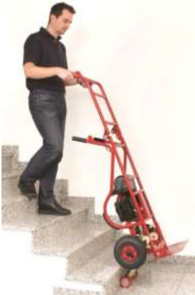
Für hohe Lasten z.B. Getränkeautomaten