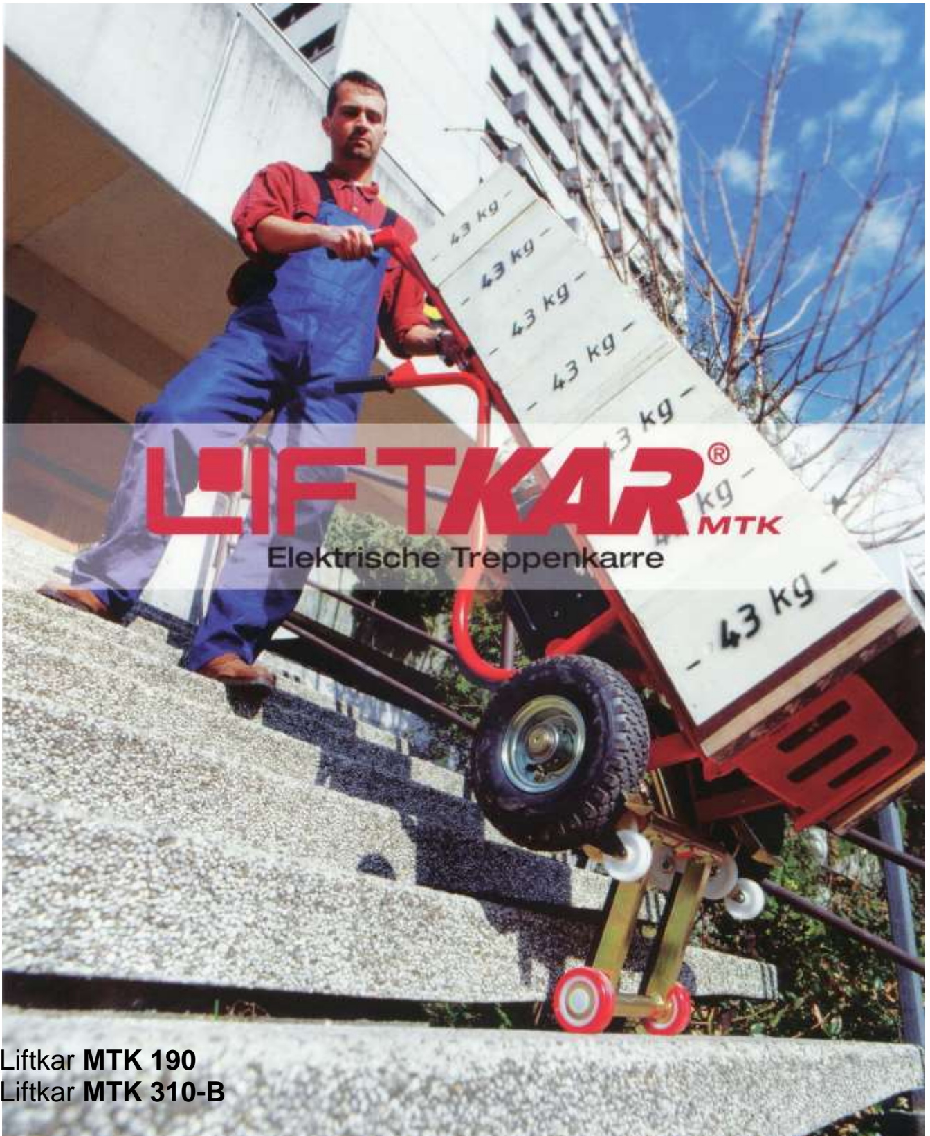
Liftkar MTK 190 Liftkar MTK 310-B